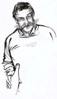
«Moustache» croqué par Jacques Guibillon