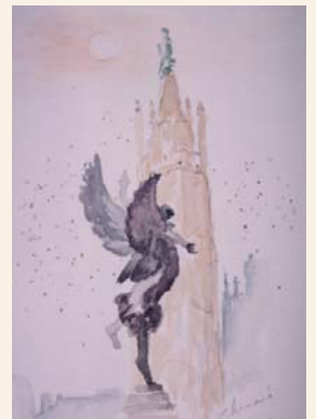
Statue «Le triomphe des vaincus» place Jean Moulin. Aquarelle de Christiane Armand

Peinture et société au temps des impressionnistes. Deux sites d'exposition : Galerie (Place du Colonel Raynal) et Musée des Beaux-Arts (20 cours d'Albret). Tous les jours de 11h à 18h sauf mardi et jours fériés.