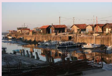
Le Port de Larros

Escale suivante à la Maison de l'Huître : bon accueil, intérêt certain, programme intelligent. En moins d'une heure nous avons tout compris à propos de l'huître depuis le naissain jusqu'à la dégustation. Histoire, science et gastronomie tout compris.