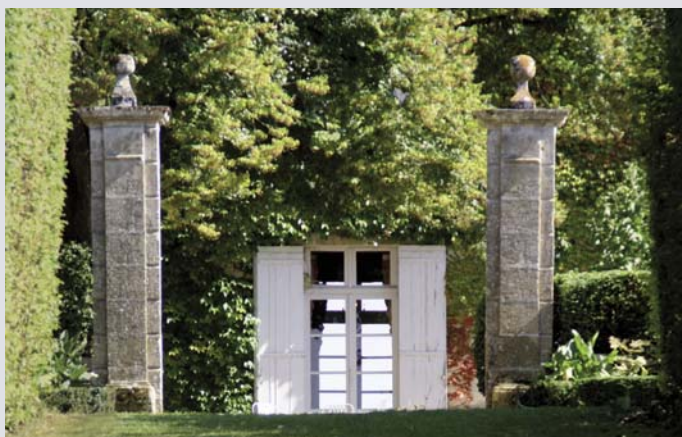
Derrière la porte entrebâillée, François Mauriac, je crois, nous attend...