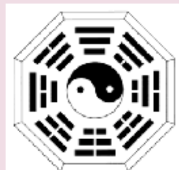
Les hexagrammes du Yi Jing (Livre des Mutations) Un ancêtre du code binaire