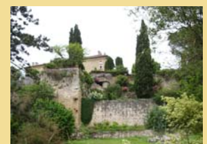
Les jardins des Remparts