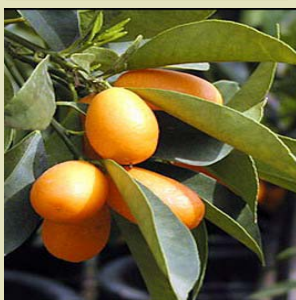
Fruits du kumquat