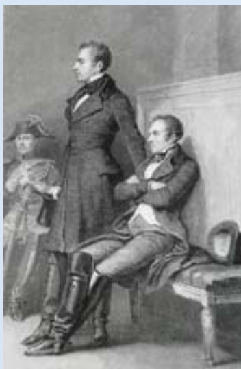
Les jumeaux de la Réole

A certaines périodes, il arrive que l'Histoire – par manque de chance - tombe entre les mains de furieux dingos. En citer un, même au hasard, en peinerait cent autres.. Evitons... Durant ces périodes, tandis que les uns passent à travers les gouttes et les cimetières prématurés... d'autres, allez savoir pourquoi, sont accablés par une guigne insatiable..