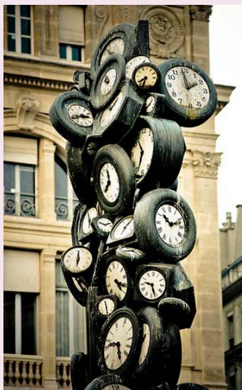
Sculpture de montres Gare Saint-Lazare à Paris