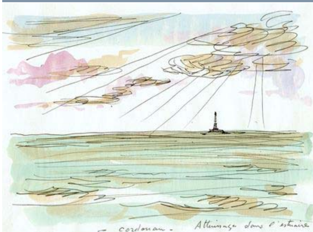
Le phare de Courdouan - Jacques Guibillon