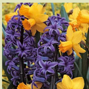
Narcisses et jonquilles