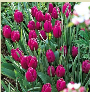
Bouquet de tulipes