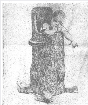
Tronc d'arbre évidé en usage, jadis, dans la Gironde, pour l'« éducation » des nourrissons.

Quel parent peut jurer qu'il n'a jamais eu envie de flanquer par la fenêtre un poupon épouvantablement braillard avec l'eau du bain ? Alors comment, diable, nos aïeux faisaient-ils, eux, pour rester zen devant le bébé