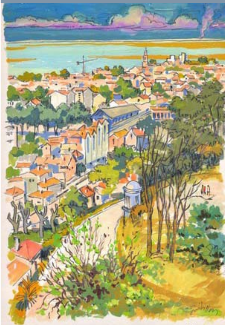
Vue d'Arcachon - Jacques Guibillon