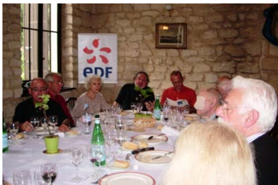
Déjeuner de sélection du Prix au siège de l'EDF