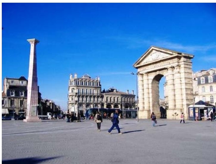
Place de la Victoire : ici s'ouvre une porte du temps...

Bonne année 2011 d'Aladin le petit futé.